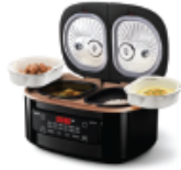
텐마인즈 밥솥 일자별 2명